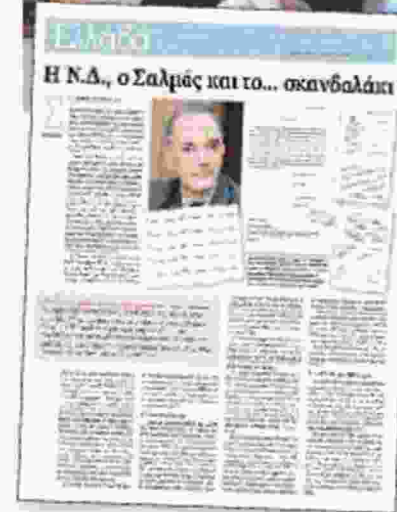
Το πρώτο από τα πολλὰ αποκλειστικά δημοσιεύματα της «Εφ.Συν.» για την επίμαχη υπόθεση

Μ. Σαλμάς. Υπενθυμίζεται πως στις 22 Δεκεμβρίου 2014, λίγο καιρό πριν από τις εκλογές του Ιανουαρίου του 2015 με