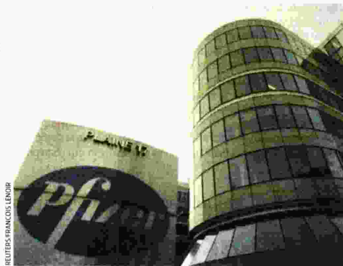
Γραφεία της μητρικής εταιρείας Pfizer.

Θα πρέπει να επιστημονούμε ότι η μητρική εταιρεία είχε προχωρήσει σε ισχυρή κεφαλαιακή τόνωση στην ελληνική θυγατρική μετά το PSI του 2012, όμως η σημαντική κερδοφό-