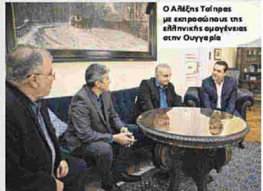
Ο Αλέξης Τσίπρας με εκπροσώπους της ελληνικής ομογένειας στην Ουγγαρία

▶ Λίγο πριν αναχωρήσει από την ουγγρική πρωτεύουσα, ο Έλληνας πρωθυπουργός συναντήθηκε με εκπροσώπους της ελληνικής ομογένειας στην Ουγγαρία, στην πρεσβεία της Ελλάδας. Ο Αλ. Τσίπρας ανέφερε ότι ο Ούγγρος πρωθυπουργός τον ενημέρωσε πως έχουν γίνει κάποια έργα στο χωριό Νίκος Μπελογιάννης. «Το Μπελογιάννης και τα μάτια σου, του είπα», συνέχισε, αναφερόμενος στη συνάντηση που είχε με τον Β. Ορμπαν. Ο Αλ. Τσίπρας επισήμανε την πολύ σημαντική ιστορία του χωριού που φέρει το όνομα «ενός ήρωα που έδωσε τη ζωή του για τις ιδέες του και για να είναι η χώρα μας ελεύθερη». Πρόσθεσε ότι ο Μπελογιάννης τιμήθηκε στην Ουγγαρία και ότι πρόσφατα τιμήθηκε κι από εμάς στην Ελλάδα, με το Μουσείο Μπελογιάννη στη γενέτειρά του.