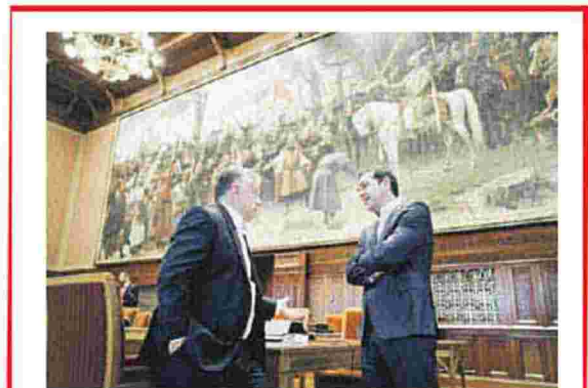
ΣΥΜΦΩΝΙΑ ΜΕ ΤΟΝ ΟΥΓΓΡΟ ΠΡΩΘΥΠΟΥΡΓΟ