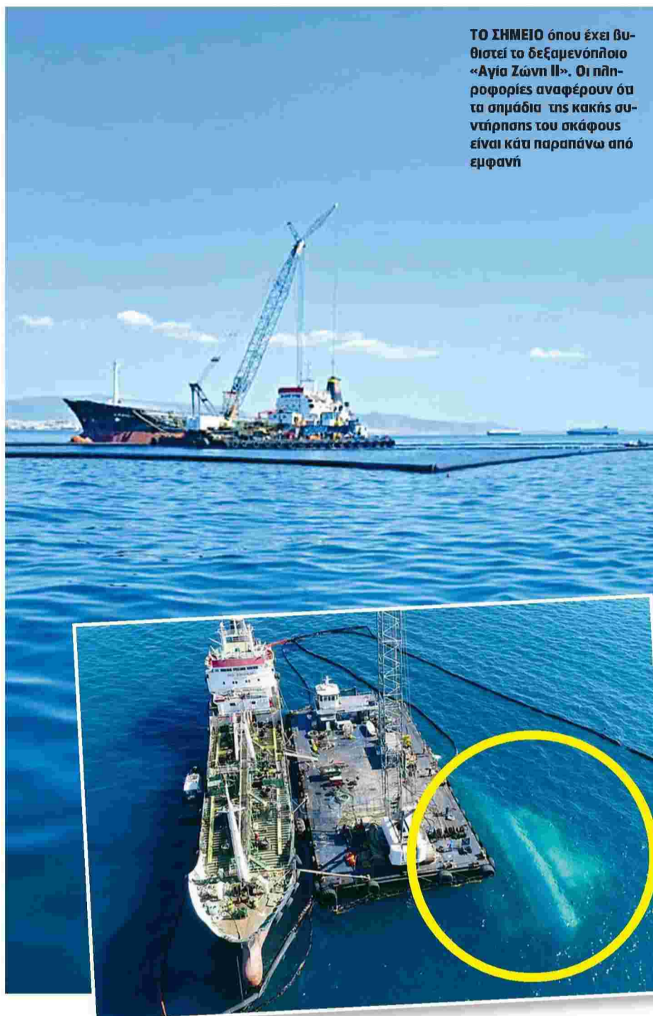
ΤΟ ΣΗΜΕΙΟ όπου έχει βυθιστεί το δεξαμενόπλοιο «Αγία Ζώνη II». Οι πληροφορίες αναφέρουν ότι τα σημάδια της κακής συντήρησης του σκάφους είναι κάτι παραπάνω από εμφανή