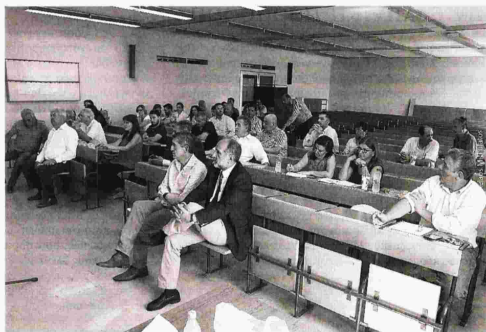
Αρκετοί φορείς ανταποκρίθηκαν στην πρόκληση. Οι κυβερνητικοί παράγοντες ωστόσο είδαν πολιτική κακοτοπιά και απείχαν

Της ΜΑΡΙΝΑΣ ΡΙΖΟΓΙΑΝΝΗ rizogianni@pelop.gr