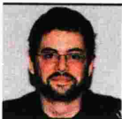
Επιμέλεια ΓΙΩΡΓΟΣ ΚΑΛΛΙΝΗΣ

υπουργό Υγείας και οικονομικοτεχνική μελέτη, σύμφωνα με την οποία εφόσον λειτουργήσει η εν λόγω μονάδα παραγωγής ραδιοφαρμάκου για τα δύο δημόσια νοσοκομεία που διαθέτουν το μηχάνημα PET/CT (ΓΝ Παπαγεωργίου και Θεαγένειο) στη Θεσσαλονίκη, τότε σε έναν χρόνο θα γίνει η απόσβεση του κόστους της εγκατάστασης του ειδικού μηχανήματος