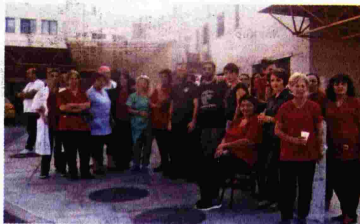
Με στάσεις εργασίας συνεχίζουν τον αγώνα τους οι εργαζόμενοι στην καθαριότητα στο Νοσοκομείο Δράμας

«Ο "θρίαμβος" αυτός πάει χέρι χέρι με την προσπάθεια της διοίκησης να παρουσιαστεί ως εκείνη που αντιπαρτίθεται στους εργολάβους... Η αλήθεια είναι πως όλα το προηγούμενο διάστημα, με τη στήριξη και της διοίκησης του ΓΝΚ, ο εργολάβος είχε ξεσάλωσε σε βάρος των δικαιωμάτων των εργαζόμενων. Δεν είναι τυχαίο πως όταν ως Σωματείο αποκαλύψαμε αυτές τις καταστάσεις (κλοπή δεδουλευμένων, τρομοκρατία, εκδικητικές απολύσεις κ.ά.) και οργανώσαμε τους εργαζόμενους, για να διεκδικήσουν τα δικαιώματά τους, βρήκαμε απέναντί μας πέρα από τον εργολάβο και την ίδια τη διοίκηση του ΓΝΚ, χρησιμοποιώντας μάλιστα τα ίδια επιχειρήματα και μεθοδεύσεις εναντίον μας... Και ενώ συνέβαιναν όλα αυτά, η διοίκηση του ΓΝΚ ανανέωνε τη μία σύμβαση μετά την άλλη στον εργολάβο, με πολλές δεκάδες χιλιάδες ευρώ, ενώ ο τελευταίος δεν πληρού-