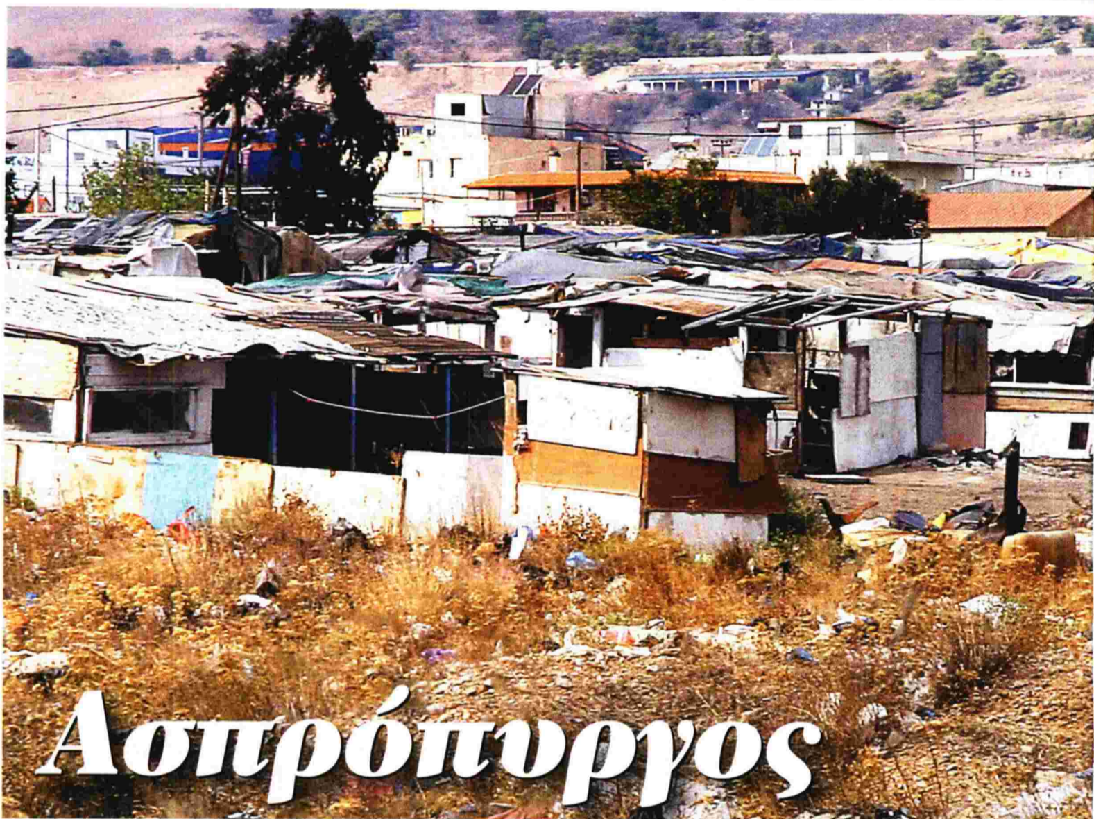
ΤΑ ΝΕΑ ΚΟΣΤΙΑΣ ΚΑΤΣΙΠΛΑΝΗΣ

Είμαστε στο Μούλκι, την καλύτερη περιοχή κάποτε, γιατί είχε νερό και καλλιέργειες. Δίπλα στο κτήμα με τις φιστικιές, υπάρχουν όγκοι από καμένα λάδια και τεράστια κοντέινερς με άγνωστο περιεχόμενο. Χωρίς εξόδους διαφυγής, μεγάλες βιομηχανίες δίπλα δίπλα. Τα Διυλιστήρια, η Χάλυψη και η μεγαλύτερη