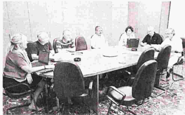
Ο Ιατρικός παρατηρεί ότι η προσπάθεια του Οργανισμού να πατάξει τις εικονικές επισκέψεις τον έκανε αφόρητα παρεμβατικό

κανόνες της ιατρικής ευθύνης απέναντι στον ασθενή και θέτει ανισότιμους κανόνες στην άσκηση της ιατρικής, προκαλώντας αθέμιτο ανταγωνισμό στην παροχή ΠΦΥ και ανισότιπες πρόσβασης των πολιτών στα ιατρεία» σημειώνεται σε ανακοίνωση του Συλλόγου ο οποίος διευκρινίζει πως: «Η πάταξη των εικονικών επισκέψεων είναι επιθυμητή και δίκαιη όταν προκαλεί στοχευμένη ανίχνευση παραβατικότητας». Μάλιστα προτείνει μία σειρά από τρόπους με τους οποίους μπορεί αυτό να συμβεί. «Η εφιαλτική κατάσταση από την αναλγησία της διοίκησης του Οργανισμού έχει εξαντλήσει κάθε όριο υπομονής και αντοχής των ιατρών, που αμεί-