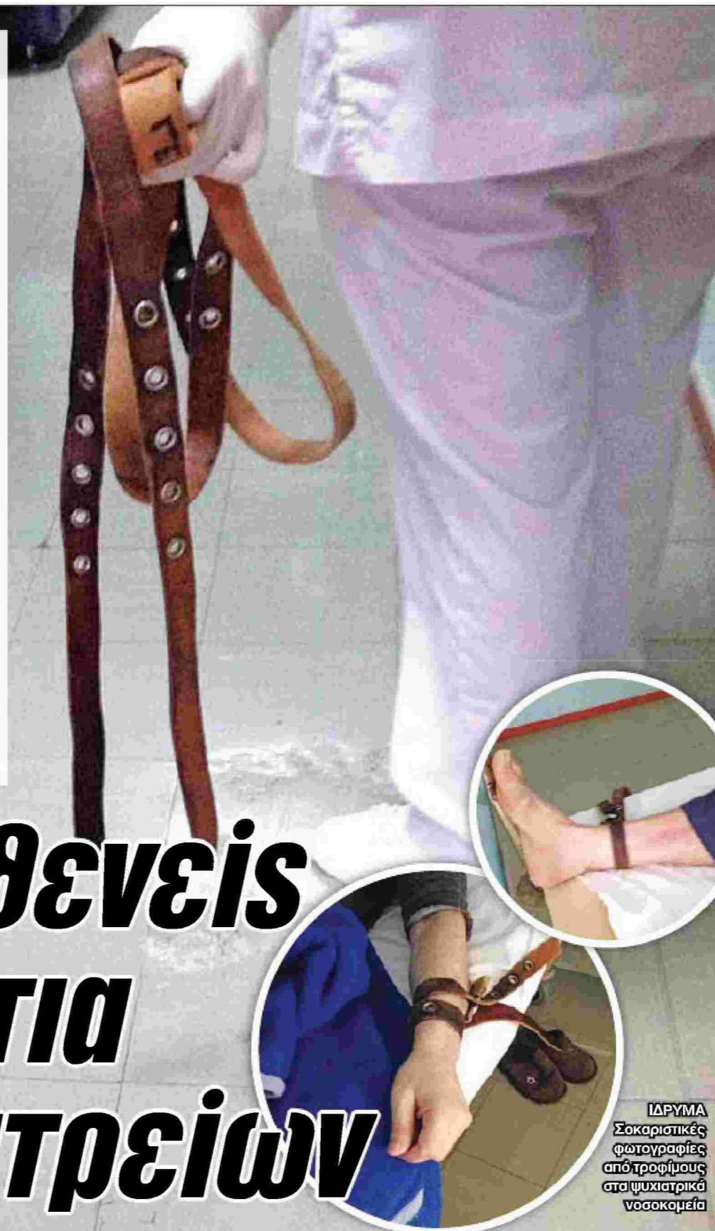
ΙΔΡΥΜΑ Σοκαριστικές φωτογραφίες από τροφίμους στα ψυχιατρικά νοσοκομεία