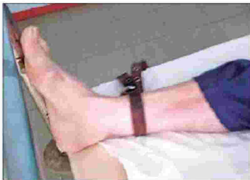
Φωτογραφίες που έδωσε η ΠΟΕΔΗΝ στη δημοσιότητα με δεμένους ασθενείς στα ψυχιατρικά νοσοκομεία

Τριπλάσιες οι εισαγωγές στα χρόνια της κρίσης