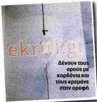
Δένουν τους ορούς με κορδόνια και τους κρεμάνε στην οροφή