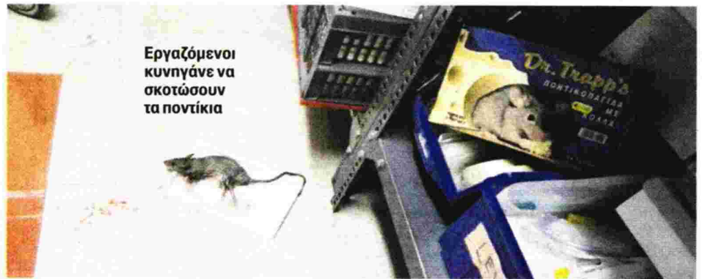
Εργαζόμενοι κυνηγάνε να σκοτώσουν τα ποντίκια

Οι εικόνες από πολλά νοσοκομεία σε όλη τη χώρα σοκάρουν.