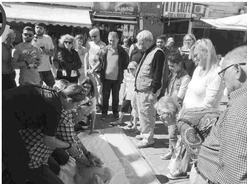
Η χθεσινή εκδήλωση πραγματοποιήθηκε στην πλατεία Συντριβανιού στο παλιό λιμάνι όπου οι εργαζόμενοι του ΕΚΑΒ προχώρησαν σε επίδειξη καρδιακής αναζωογόνησης, την οποία παρακολούθησε μεγάλος αριθμός Χανιωτών αλλά και επισκεπτών.

Τα στελέχη του ΕΚΑΒ Χανίων προτείνουν να τοποθετηθούν αυτόματοι απιδινωτές σε χώρους της πόλης (με την ίδια λογική που έχουν μπει πυροσβεστήρες) και όλα τα σημεία να χαρτογραφηθούν και να "ανέβουν" στο διαδίκτυο ώστε να γνω-