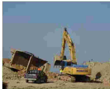
ΦΩΤΟΓΡΑΦΙΑ ΝΤΟΚΟΥΜΕΝΤΟ: Σάββατο, 18 Μαρτίου 2017, στο εργοτάξιο της Νέας Ελβετίας τουμπάρισε ένα μεγάλο φορτηγό. Ο οδηγός τραυματίστηκε ελαφρά.