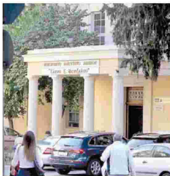
Από το υπόγειο του νοσοκομείου «Ελενα Βενιζέλου» ξεκίνησε ο λάθος συναγερμός για χολέρα.

Η τελευταία επιδημία χολέρας στην Ελλάδα ήταν το 1912-1913, κατά τους Βαλκανικούς Πολέμους.