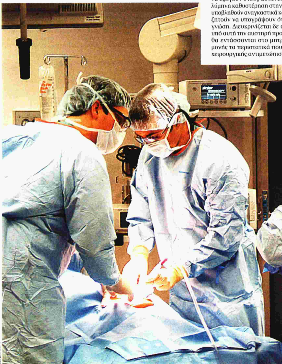
ΕΥΡΩΚΙΝΗΣΗ / ΤΑΤΙΑΝΑ ΜΙΤΣΟΡΑΦΗ

Ε λλείπει απαραίτητων υλικών για βαριές επεμβάσεις – ακόμη και για την αντιμετώπιση ογκολογικών ασθενών –, αναβάλλονται χειρουργεία στο Λαϊκό Νοσοκομείο. Το νοσηλευτικό ίδρυμα αδυνατεί να αντιμετωπίσει χειρουργικά περιστατικά, κλείνοντας στους ασθενείς ραντεβού για τον ερχόμενο Μάρτιο.