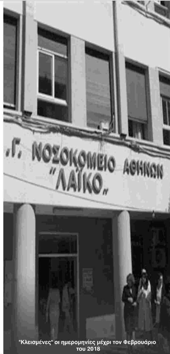
"Κλεισμένες" οι ημερομηνίες μέχρι τον Φεβρουάριο του 2018