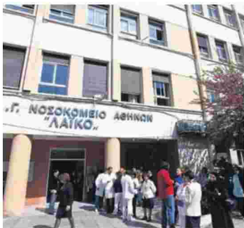
Και η διοίκηση του Λαϊκού επιβεβαιώνει σε απάντησή της τον χρόνο αναμονής για χειρουργείο.

ΑΝΑΜΟΝΗ τουλάχιστον τεσσάρων μηνών έχουν τα χειρουργεία του Λαϊκού Νοσοκομείου, σύμφωνα με έγγραφο του διοικητή του νοσοκομείου.