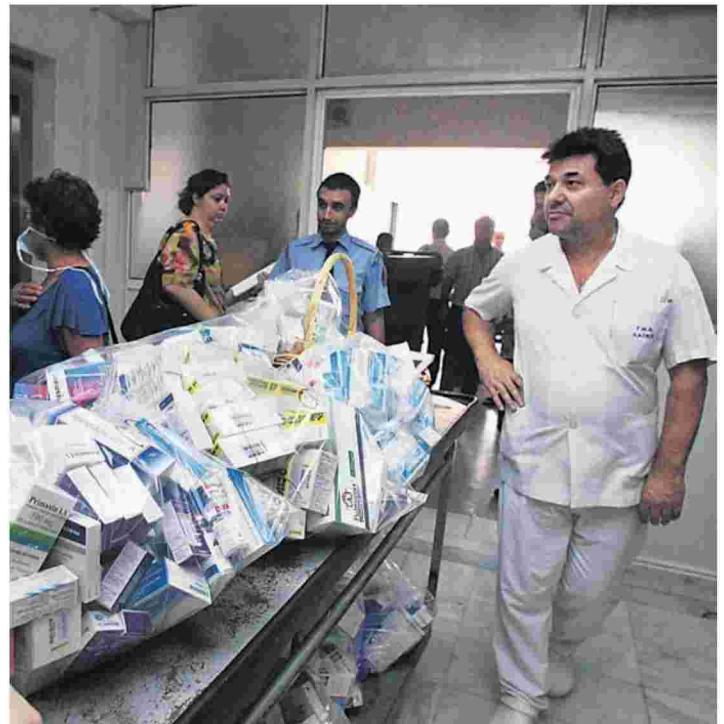
Η απόφαση της ελβετικής φαρμακευτικής εταιρίας να βγάλει το φάρμακο από τη θετική λίστα σήκωσε θύελλα αντιδράσεων και κυρίως στους ασθενείς, οι οποίοι κινδυνεύουν να μείνουν χωρίς θεραπεία.

«Η αποσπασματική λήψη μέτρων, χωρίς καμία πρότερη επικοινωνία και διαβούλευση με τους εταίρους στο χώρο της ογκολογίας, τις επιστημονικές ιατρικές εταιρίες και τους εκ-