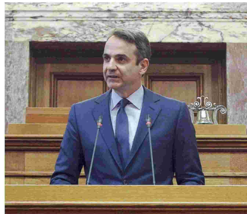
Ο πρόεδρος της Ν.Δ. Κυρ. Μητσοτάκης αναμένεται να αναφερθεί από τα Ιωάννινα και στη συνταγογράφηση.

Την ίδια ώρα, από τα Ιωάννινα, ο κ. Μητσοτάκης αναμένεται να προαναγγείλει και άλλες δεσμεύσεις που αφορούν την αλληλεγγύη, να μιλήσει πιο αναλυτικά για το ελάχιστο εγγυημένο εισόδημα, για το ασφαλιστικό, καθώς και για την αντιμετώπιση της φτώχειας, καταδεικνύοντας, ωστόσο, την ίδια ώρα, ότι ο μόνος τρόπος για την αντιμετώπιση της φτώχειας είναι με δουλειές και όχι με επιδόματα. Βαρύ πυροβολικό έχει επιλεγεί και στους ομιλητές πέραν των νεοδημοκρατικών τεικών, καθώς ο Πάνος Τσακλόγλου αναμένεται να μιλήσει με προτάσεις για την αντιμετώπιση της φτώχειας