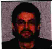
Επιμέλεια ΓΙΩΡΓΟΣ ΚΑΛΛΙΝΗΣ

Σ τις γυναίκες είναι αφιερωμένη η φετινή Παγκόσμια Ημέρα κατά του Διαβήτη, καθώς η συχνότητα της νόσου στο γυναικείο φύλο είναι παραγνωρισμένη. Σήμερα, στην Ελλάδα εκτιμάται ότι 354.000 γυναίκες πάσχουν από διαβήτη τύπου 2 ελαφρώς περισσότερες από τους άνδρες ασθενείς, ενώ παγκοσμίως οι γυναίκες με διαβήτη ανέρχονται σε 200 εκατομμύρια.