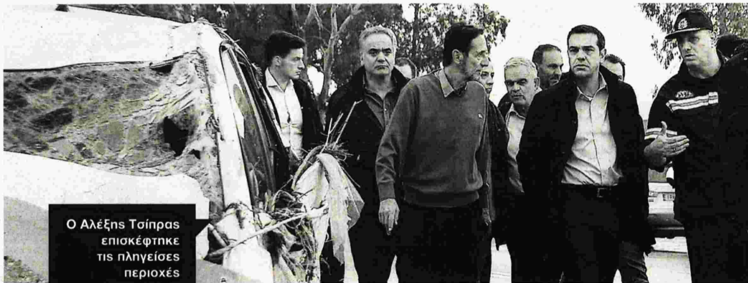
Ο Αλέξης Τσίπρας επισκέφτηκε τις πληγείσες περιοχές επικεφαλής κυβερνητικού κλιμακίου

Η περιφερειάρχης Αττικής προχώρησε πάντως στην υποβολή μνυτήριας αναφοράς στον Αρειο Πάγο προκειμένου να αναζητηθούν - όπως είπε - ευθύνες για την τραγωδία. Κίνηση που είναι φανερό πως υπαγορεύτηκε από όρους επικοινωνιακής διαχείρισης, η οποία δεν εξαιρεί τον κίνδυνο στις τυχόν ευθύνες να εμπλακεί και η ίδια.