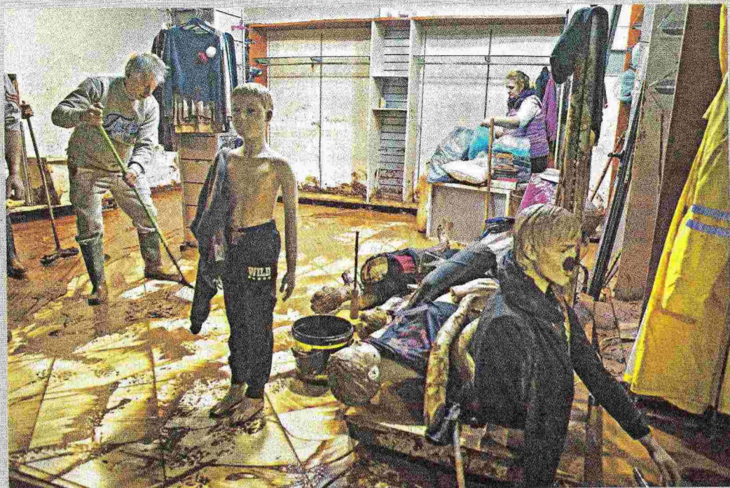
Ανάμεσα στις σπασμένες κούκλες, οι άνθρωποι γελάνε πικρά όταν τους ρωτάω για ασφάλιστρα και κάλυψη της ζημιάς. «Θα στείλεις... Είναι η τρίτη φορά που χάνουμε τα πάντα. Αυτό δεν σώζεται με τίποτα»