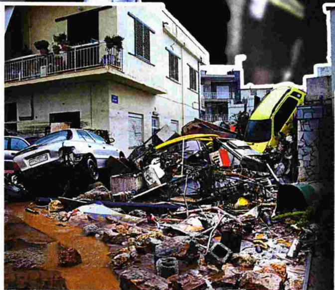
ΤΑ ΝΕΑ ΚΟΣΤΑΣ ΚΑΤΣΙΓΙΑΝΝΗΣ