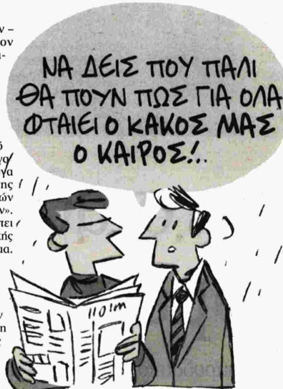
ΤΟΥ ΚΩΣΤΑ ΣΚΛΑΒΕΝΙΤΗ

Για να λυθεί το πρόβλημα της αντιπλημμυρικής προστασίας χρειάζεται - εκτός από την Περιφέρεια - να ενεργοποιηθεί, προς αυτήν την κατεύθυνση, όλη η κυβέρνηση. Το κόστος για τη συνολική αντιπλημμυρική προστασία της Αττικής ανέρχεται σε περίπου 3 δισ. ευρώ. Σε αυτό το ποσό συμπεριλαμβάνονται και τα έργα οριοθέτησης των ρεμάτων - με τις απαραίτητες εργασίες στήριξης.