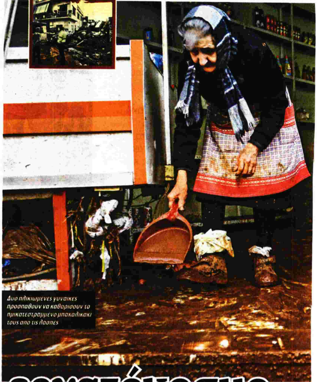
Δυο ηλικιωμένες γυναίκες προσπαθούν να καθαρίσουν το ημικατεστραμμένο μπακαλικάκι τους από τις ήσυχες