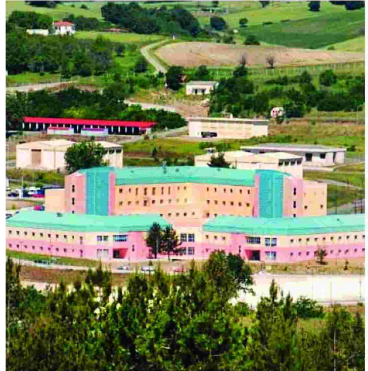
Ήδη το νοσοκομείο έχει λάβει το εθνικό βραβείο Energy Globe Ελλάδας 2017, για δράσεις ορθής διαχείρισης ενέργειας εντός των χώρων του.

«Η ορθολογική διαχείριση της ενέργειας είναι θέμα οικονομίας και εκπαίδευσης προσωπικού. Το ζητούμενο ήταν όλοι οι εργαζόμενοι να μπουν στη λογική της