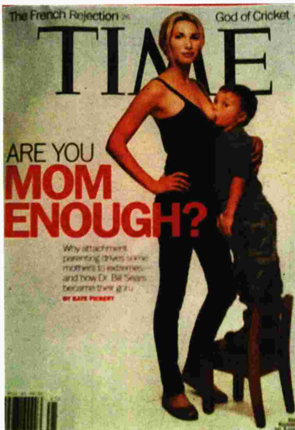
Διαμάχες πυροδοτεί η ηλικία που πρέπει να σταματούν τα παιδιά τον θηλασμό, όπως είχε θίξει και το περιοδικό «Time». Επώνυμες, όπως η Ζιζέλ, άνοιξαν πάντως τον δρόμο θηλασμού σε εργασιακούς χώρους