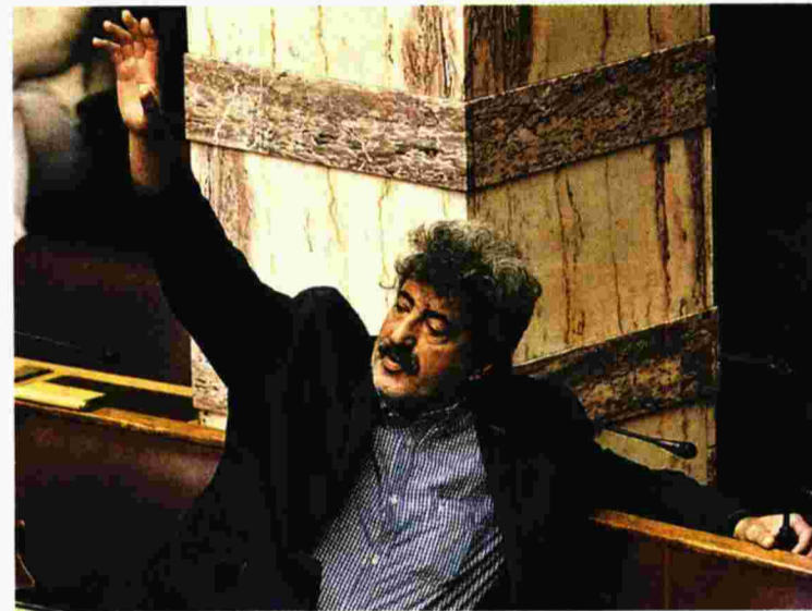
Μια ανάρτηση του Πολάκη στο facebook, όπου μίλησε για «πλοκάμια του παρακράτους» αναφερόμενος σε μια καταγγελία συνεργάτηδός του προκάλεσε την έντονη αντίδραση των εργαζομένων στο Σισμανόγλειο

Για να διαπιστώσει κανείς την «οικονομική βόμβα» στο οικονομικά εξασθενωμένο δημόσιο σύστημα υγείας αρκεί να αναλογιστεί ότι η δαπάνη για την περίθαλψη ανασφαλιστών πολιτών και αλλοδαπών αλλά και ασθενών με βιβλιάριο απορίας μόνον στα νοσοκομεία της Αθήνας έφτασε πέρυσι τα 57,2 εκατομμύρια ευρώ.