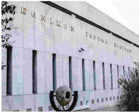
Η ίδρυση του κέντρου αποτελεί πρωτοβουλία του Εθνικού Ιδρύματος Ερευνών

Στην ψυχική στήριξη των ασθενών με καρκίνο έδωσε έμφαση κατά τον χαιρετισμό του ο Προκόπης Παυλόπουλος. Αυτές τις ασθέ-