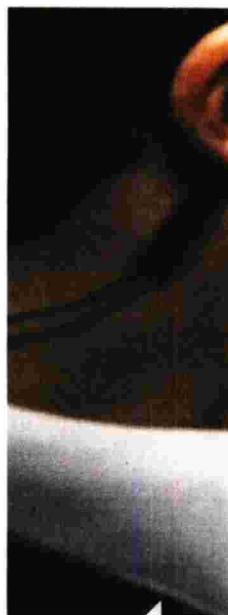
Από τη χθεσινή επεισοδιακή επίσκεψη του Αλέξη Τσίπρα στη Θεσσαλονίκη