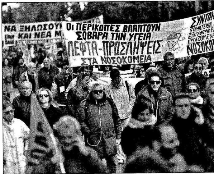
Εικοσιτετράωρη γενική πανεργατική απεργία έχουν προκηρύξει σήμερα ΓΣΕΕ και ΑΔΕΔΥ, στην οποία συμμετέχουν ΠΝΟ, ΤΡΑΙΝΟΣΕ, ΓΕΝΟΠ-ΔΕΗ και υπηρεσίες δημόσιας υγείας (ΠΟΕΔΗΝ, ΟΕΝΓΕ)

Σύμφωνα με την ΤΡΑΙΝΟΣΕ, δεν θα πραγματοποιηθεί κανένα δρομολόγιο από τα μεσάνυχτα της Τετάρτης έως τα μεσάνυχτα της Πέμπτης. Ειδικότερα, ματαιώνονται τα βραδινά δρομολόγια στον άξονα Αθήνα-Θεσσαλονίκη που αναχωρούν τα μεσάνυχτα της Τετάρτης. Οι αμαξοστοιχίες 600/601 (από Αθήνα και Θεσσαλονίκη) που αναχωρούν στις 23:55 και 23:00 αντίστοιχα, το βράδυ της Πέμπτης, θα κυκλοφορήσουν μετά τη λήξη της απεργίας. Για τις αμαξοστοιχίες των οποίων τα δρομολόγια επηρεάζονται από τις κινητοποιήσεις, η ΤΡΑΙΝΟΣΕ Α.Ε. έχει προληπτικά κλείσει το σύστημα έκδοσης εισιτηρίων. Οι επιβάτες ωστόσο που επρόκειτο να ταξιδέψουν το χρονικό διάστημα αυτό και έχουν ήδη αγοράσει εισιτήρια από φυσικά σημεία πώλησης, δικαιούνται επιστροφή του αντιτίμου των εισιτηρίων είτε σε μετρητά, είτε με τη μορφή «κουπονιού ταξιδιού». Για τους επιβάτες που έχουν αγοράσει