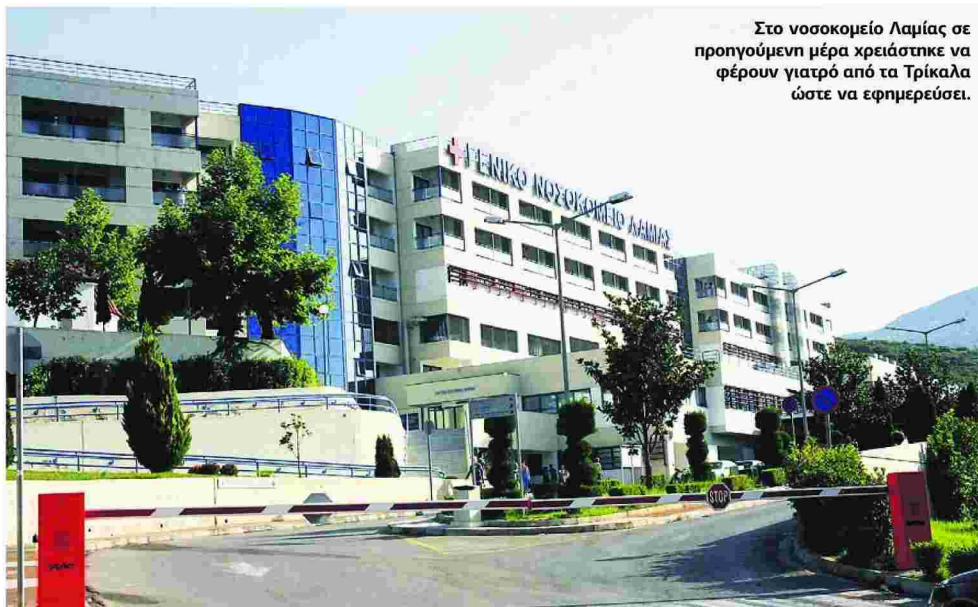
Στο νοσοκομείο Λαμίας σε προηγούμενη μέρα χρειάστηκε να φέρουν γιατρό από τα Τρίκαλα ώστε να εφημερεύσει.