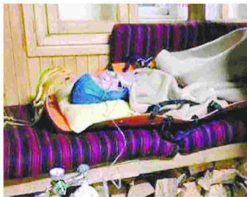
Πριν από τη διακομιδή σε νοσοκομείο της Λάρισας, η 35χρονη ορειβάτισσα είχε μεταφερθεί με φορείο σε καταφύγιο, όπου έγινε η πρώτη διάγνωση