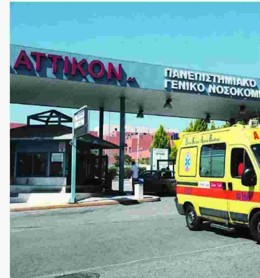
Η διοίκηση του Αττικού δικαιολογείται προς τους καρκινοπαθείς που διαμαρτύρονται ότι τελείωσε το έτος και υπήρξε πρόβλημα διαχείρισης των αποθεμάτων.