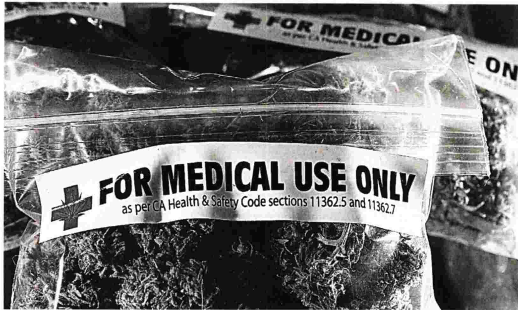
Ελλείμμα ενημέρωσης υπάρχει ακόμα και στην επιστημονική κοινότητα στο ζήτημα της ιατρικής χρήσης της κάνναβης

ΑΝΑΚΑΛΥΨΗ. «Από τις μεγαλύτερες ανακαλύψεις των τελευταίων ετών είναι το λεγόμενο ενδοκανναβινοειδές σύστημα. Πρόκειται για σύστημα - κρίσιμο όπως το ανοσοποιητικό - που ακουμπάει τις περισσότερες λειτουργίες του ανθρώπινου οργανισμού. Με το σύστημα αυτό σχετίζεται και η δράση των κανναβοειδών». Σήμερα η θεραπευτική κάνναβη συνταγογραφείται σε 14 χώρες της Ευρωπαϊκής Ένωσης, ενώ σε καμία δεν επιτρέπεται η ιδιωτική καλλιέργεια. Ενδεικτικά, στη γειτονική Ιταλία ο διάλογος είχε αρχίσει το 2007 και έπειτα από επτά χρόνια δόθηκε η έγκριση στους γιατρούς να προτείνουν την κάνναβη ως νόμιμη θεραπεία.