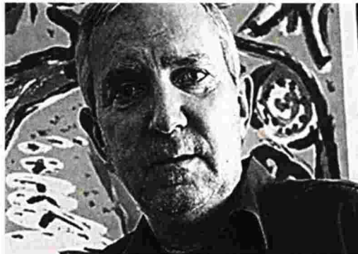
«Αυτό που θα πρέπει να ξέρει ο κόσμος είναι ότι τα κανναβοειδή δεν είναι μόνο η ινδική κάνναβη και η «διασκεδαστική» χρήση του χασίς» λέει ο νευρολόγος - ψυχίατρος Ανδρέας Παπαθεοδώρου