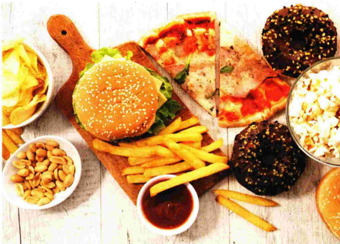
Η προσφυγή σε υδατάνθρακες και τροφές με απλή ενεργειακή αξία έχουν μοιραία αποτελέσματα για την εμφάνιση του διαβήτη, σύμφωνα με τον ενδοκρινολόγο-διαβητολόγο, Γεώργιο Σαμαρτζή

Ο διαβήτης τύπου 1 συνήθως εισβάλλει απότομα, με οξεία συμπτώματα (πολυουρία, πολυδιψία, πολυφαγία, απώλεια βάρους) και οδηγεί, συχνά, στην ανάπτυξη διαβητικής κετοξέωσης και, όχι σπάνια, σε διαβητικό κώμα. Ασθενείς με διαβήτη τύπου 1 χρειάζονται οπωσδήποτε ινσουλίνη εφ' όρου ζωής και η διάγνωση σε αυτούς τους ασθενείς θα τεθεί από τον ιατρό που, λόγω των έντονων συμπτωμάτων, θα κληθεί να αντιμετωπίσει το περιστατικό.