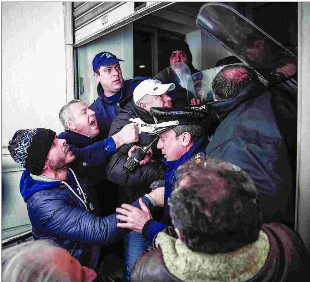
Μικροσυμπλοκές μεταξύ μελών της ΠΟΕΔΗΝ και αστυνομικών στην είσοδο του υπουργείου Υγείας