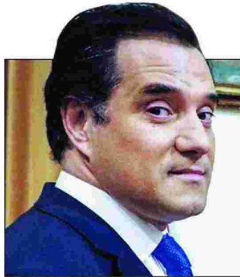
Ο Αδωνης Γεωργιάδης στην Εξεταστική Επιτροπή για την Υγεία

Για σκευωρία από τον υπουργό Υγείας έκανε λόγο ο αντιπρόεδρος της Ν.Δ., ενώ καταλόγισε μεροληψία στην επιτροπή