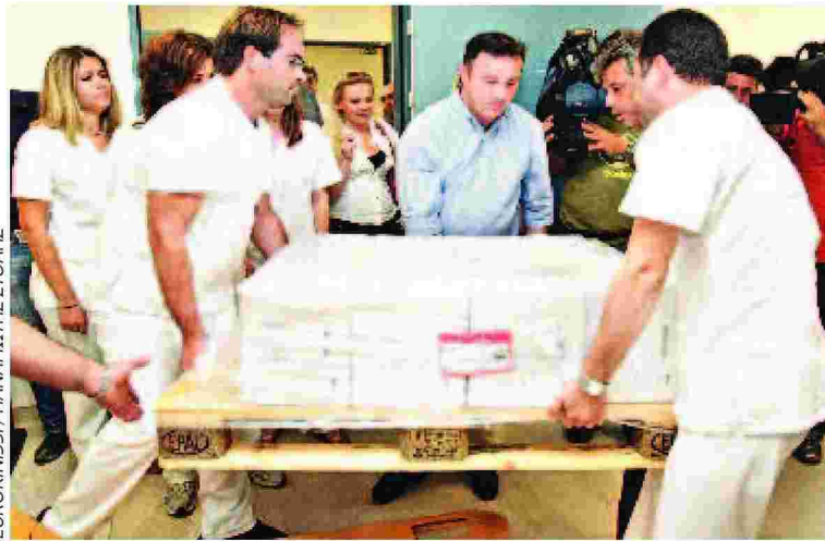
ΕΥΡΟΚΙΝΗΣΗ / ΠΑΝΑΓΙΩΤΗΣ ΣΤΟΛΗΣ

Σύμφωνα με πληροφορίες της «Εφ.Συν.» από τον ΙΦΕΤ, το κόστος των αντιικών φαρμάκων που αγοράστηκαν και δεν χρησιμοποιήθηκαν ποτέ (Tamiflu της Roche και Relenza της GlaxoSmithKline) έφτανε τα 12 εκατ. ευρώ. Το εντυπωσιακό είναι ότι πριν καν τελειώσει το σχετικό απόθεμα, κάποιοι λειτούργησαν... προνοητικά και προχώρησαν σε νέα παραγγελία τόνων δραστικής ουσίας, με αποτέλεσμα οι αποθήκες να γε-