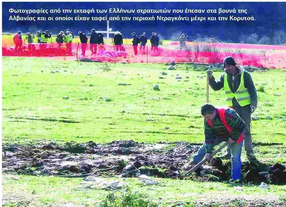
Φωτογραφίες από την εκταφή των Ελλήνων στρατιωτών που έπεσαν στα βουνά της Αλβανίας και οι οποίοι είχαν ταφεί από την περιοχή Ντραγκόντι μέχρι και την Κορυτσά.

ΓΕΕΘΑ: ΔΥΝΑΤΟΤΗΤΑ ΤΑΥΤΟΠΟΙΗΣΗΣ ΤΩΝ ΘΑΝΟΝΤΩΝ ΣΤΑ ΑΛΒΑΝΙΚΑ ΒΟΥΝΑ