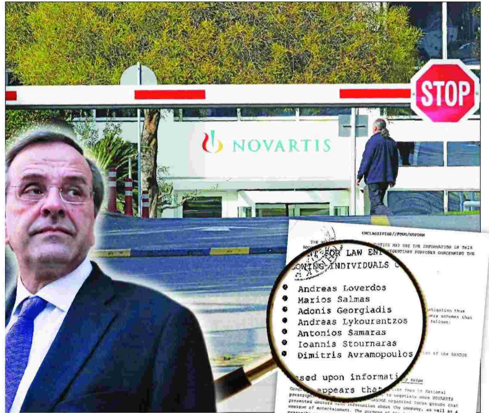
Τα γραφεία της Novartis στη Μεταμόρφωση Αττικής. Αριστερά: Ο Αντώνης Σαμαράς. Δεξιά: Σελίδα από το έγγραφο του FBI με στοιχεία για τους Έλληνες πολιτικούς

Προκύπτουν επίσης ενδιαφέροντα στοιχεία για τον χρόνο και τον αριθμό των κατα-