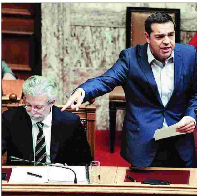
Ο Αλ. Τσίπρας με τον υπουργό Δικαιοσύνης Στ. Κοντονή

Μέγα ζητούμενο αποτελούν οι διαδρομές του «μαύρου χρήματος», δεδομένου ότι η κατηγορία περί ξηπλύματος δεν μπορεί να παραγραφεί σε καμία περίπτωση. Ωστόσο, αποτελεί σοβαρό ερώτημα αν η δικογραφία περιέχει τέτοια στοιχεία σε βάρος των εμπλεκόμενων, κάτι που θα φανεί στη συνέχεια, καθώς η υπόθεση έχει ακόμη πολύ βάθος.