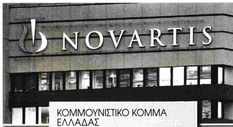
ΚΟΜΜΟΥΝΙΣΤΙΚΟ ΚΟΜΜΑ ΕΛΛΑΔΑΣ

«Το Δεκέμβριο του 2006, μετά από το περιστατικό θανάτου από μόλυνση ασθενούς κατόπιν μετάγγισης, εξαγγέλθηκε ο μεγαλύτερος διαγωνισμός που έγινε ποτέ στο χώρο της Υγείας, ύψους περίπου 200 εκατ. ευρώ, αναφορικά με την προμήθεια διαγνωστικών τεστ μοριακού ελέγχου. Τα συγκεκριμένα τεστ τα διέθεταν μόνο οι εταιρείες α) «Roche» και β) «Chiron», που ανήκει στον όμιλο «Novartis». Επίσης η «Novartis» κατέχει και το 30% των μετοχών της «Roche». Η προμήθεια ανατέθηκε για την εταιρεία «Roche» σε άλλη εταιρεία και ανερχόταν στο ύψος των 40 ευρώ ανά τεστ, και για την εταιρεία «Chiron» σε άλλη εταιρεία στο ύψος των 50 ευρώ ανά τεστ. Τα διαγνωστικά τεστ είχαν στις διάφορες χώρες