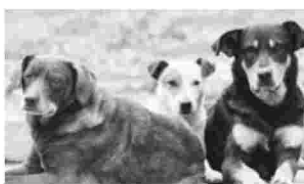
Ακυρώθηκαν 70 στείρωσεις γάτων και 16 σκύλων