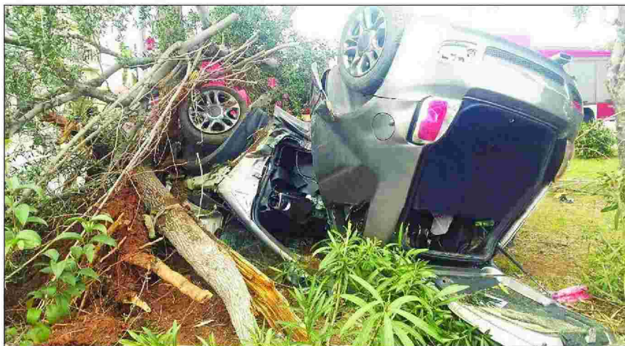
Το αυτοκίνητο στο οποίο επέβαινε ο τραγουδιστής Ηλίας Βρεττός, μετά τη σύγκρουση