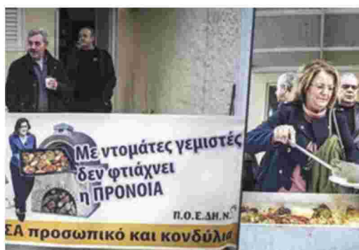
Με πρωτότυπο τρόπο διαμαρτυρήθηκαν οι εργαζόμενοι του θεραπευτηρίου στην περιοχή Σκαραμαγκά

ΝΔ: Η κατάσταση αυτή δεν μπορεί να συνεχιστεί Ο τομάρχης υγείας της Νέας