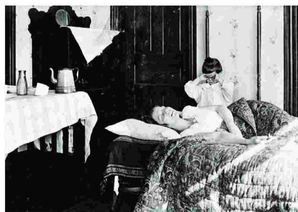
Το κορίτσι της φωτογραφίας ήταν αυτό που τηλεφώνησε στην υπηρεσία του Ερυθρού Σταυρού ανησυχώντας για τη μεγαλύτερη αδελφή της.

Πηγή: Α.Ρ. Ψηφιακή Βιβλιοθήκη της Βουλής των Ελλήνων. Ευχαριστούμε το Μουσείο Φαλιτάς της Σκύρου.