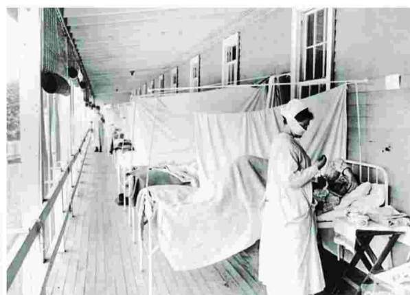
Μια νοσοκόμα ελέγχει τον σφυγμό ασθενούς στα ράντζα που στήθηκαν στις βεράντες του νοσοκομείου Walter Reed της Ουάσινγκτον τον Νοέμβριο του 1918.