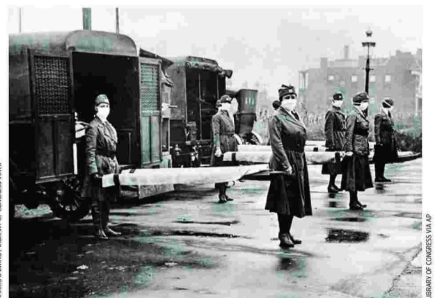
Προσωπικό του Ερυθρού Σταυρού του Σεντ Λούις των ΗΠΑ φωτογραφίζεται δίπλα στα ασθενοφόρα με μάσκες και φορεία.