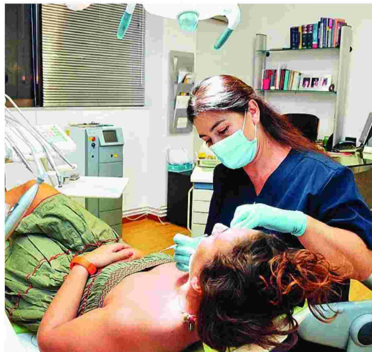
Έλληνες ειδικοί εστιάζουν και στην ανεπάρκεια των δημόσιων δομών υγείας να παρέχουν δωρεάν οδοντιατρική φροντίδα.

σώματός μας. Μία ματιά στο στόμα μπορεί να αποκαλύψει διατροφικές ελλείψεις, σημάδια άλλων νοσημάτων και ανθυγιεινές συνήθειες όπως η κατανάλωση αλκοόλ ή η χρήση καπνού. Τα στοματικά νοσήματα συνδέονται με τον διαβήτη, τις καρδιοπάθειες τα νοσήματα του αναπνευστικού και κάποιους καρκίνους. Άλλωστε, στοματικά νοσήματα και νοσήματα της γενικής υγείας μοιράζονται κοινούς παράγοντες κινδύνου, όπως η ανθυγιεινή διατροφή, το κάπνισμα, η υπερβολική κατανάλωση αλκοόλ. Η αποφυγή αυτών των παραγόντων είναι ο ένας πυλώνας της πρόληψης στοματικών παθήσεων. Ο άλλος είναι η καλή στοματική υγιεινή. Οι ειδικοί συστήνουν βούρτσισμα των δοντιών δύο φορές την ημέρα, χρήση οδοντικού νήματος, αλλά και τακτικό οδοντιατρικό έλεγχο.