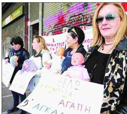
Η χθεσινή διαμαρτυρία των εργαζομένων στο «Μπτέρα» έξω από το υπουργείο Εργασίας

Αξίζει να αναφερθεί πως οι εργαζόμενες, έπειτα από αίτημά τους, θα συναντηθούν με την αναπληρώτρια υπουργό Θεανώ Φωτίου την Παρασκευή, ώστε να της παρουσιάσουν τα ζητήματα που τις απασχολούν. Σημειώνεται πως η χθεσινή κινητοποίηση είχε τη στήριξη της Πανελλήνιας Ομοσπονδίας Εργαζομένων Δημόσιων Νοσοκομείων (ΠΟΕΔΗΝ).