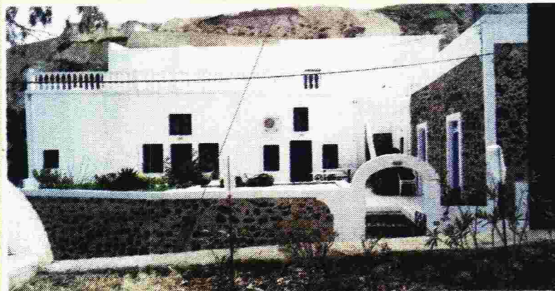
Η πολυτελής κατοικία που ενοικιάστηκε και εξοπλίστηκε πλήρως για τη διαμονή του αντιπροέδρου του Νοσοκομείου Σαντορίνης