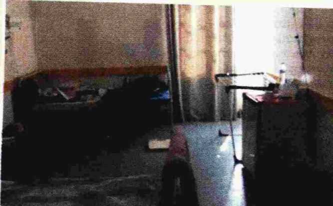
Η ΠΟΕΔΗΝ έδωσε φωτογραφία από το χώρο που διαμένουν οι εργαζόμενοι

Συνεχίζονται οι αποκαλύψεις από την Πανελλήνια Ομοσπονδία Εργαζομένων Δημόσιων Νοσοκομείων (ΠΟΕΔΗΝ) για τα έργα και τις ημέρες του αντιπροέδρου του Νοσοκομείου Σαντορίνης και πρώην συνεργάτη του αναπληρωτή υπουργού Υγείας, κ. Μπάμπη Πανοτόπουλου.