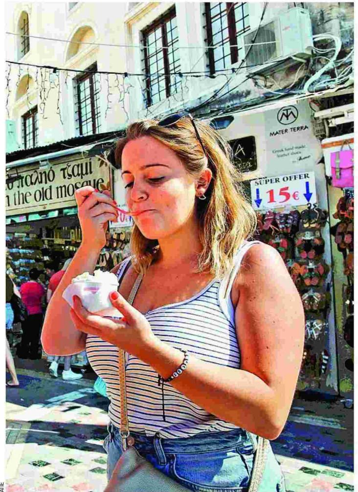
Επιτήδευοι διατροφολόγοι-διαιτολόγοι πρότειναν σε ανυποψίαστους πελάτες μέχρι και δίαιτες με βάρφες και παγωτά...

Δεν είναι η μόνη υπόθεση που έχει κυνηγήσει το τελευταίο διάστημα η ΕΔΔΕ. Πρόσφατα, κατόπιν ενεργειών της, η Διεύθυνση Δημόσιας Υγείας της Περιφέρειας Αττικής υποχρέωσε γιατρό που δήλωνε ορθομοριακός διαιτολόγος-διατροφολόγος να κατεβάσει τη σχετική ταμπέλα, αφού δεν διέθετε τους απαιτούμενους τίτλους σπουδών. Σε άλλη περίπτωση, διατροφολόγος, κατά δήλωσή της, με συχνή παρουσία σε τηλεοπτικές εκπομπές, καταδικάστηκε για παράνομη άσκηση επαγγέλ-