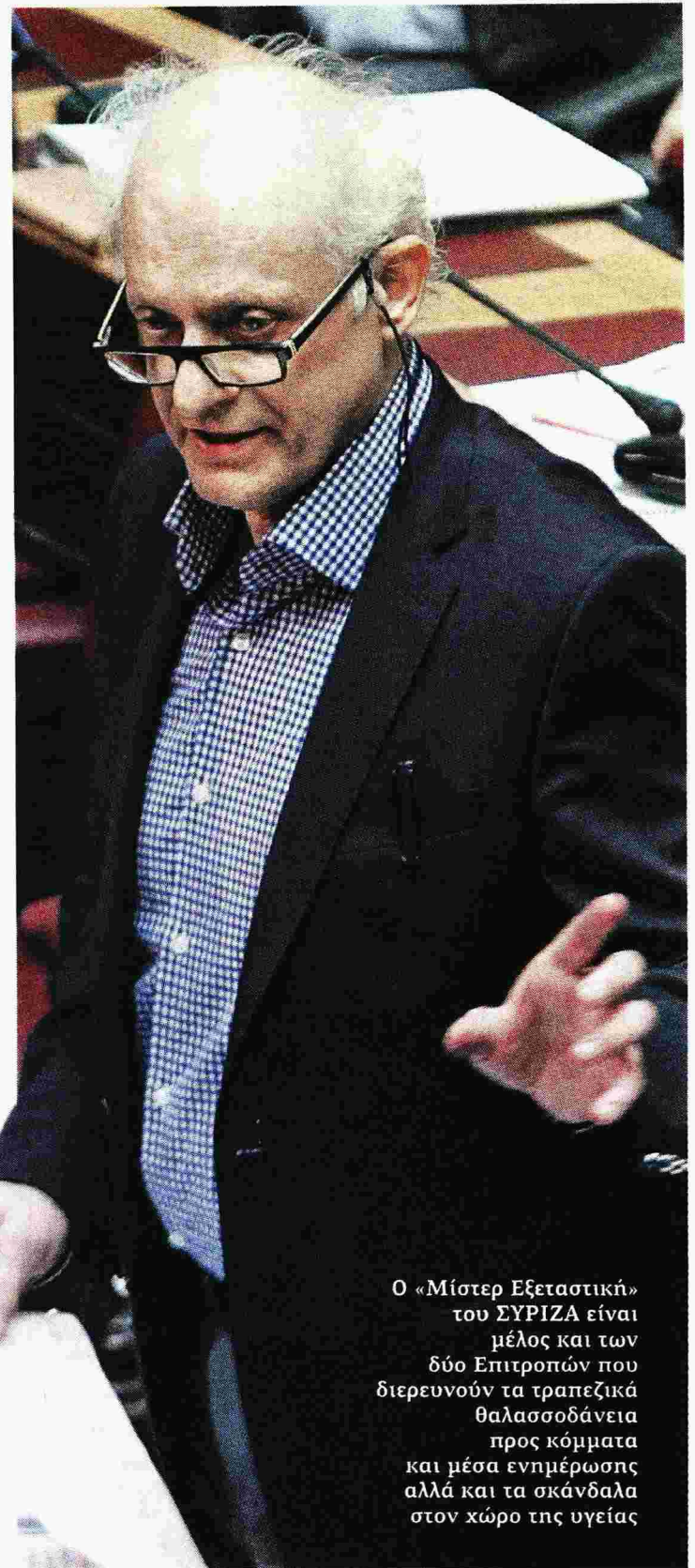
Ο «Μίστερ Εξεταστική» του ΣΥΡΙΖΑ είναι μέλος και των δύο Επιτροπών που διερευνούν τα τραπεζικά θαλασσοδάνεια προς κόμματα και μέσα ενημέρωσης αλλά και τα σκάνδαλα στον χώρο της υγείας

Εμφανίζεται βέβαιος, ωστόσο, ότι θα υπάρξει δικαιοσύνη. «Η σύσταση της Επιτροπής αυτής,