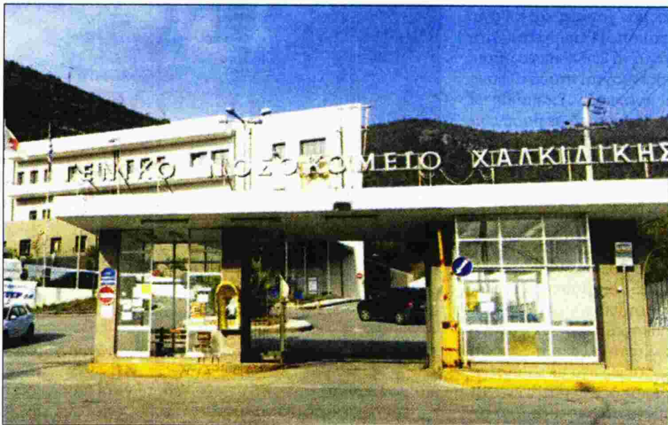
Το νοσοκομείο στον Πολύγυρο Χαλκιδικής

Ο ίδιος καταγγέλλει ακόμη ένα πολύ σοβαρό πρόβλημα στην καθημερινή λειτουργία του νοσοκομείου. «Όλο το 2017, αλλά και φέτος, ο αξονικός τομογράφος λειτουργεί