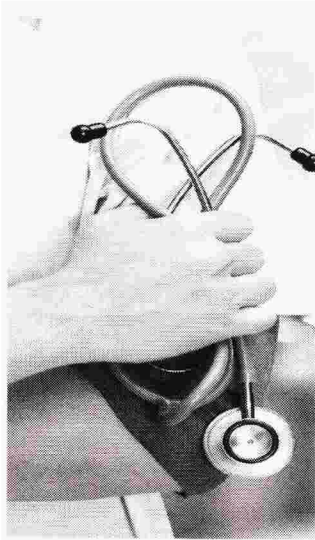
Πρωτοβουλία της ΚΕΔΕ σε όλη τη χώρα.