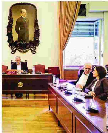
Την ερχόμενη Τρίτη θα πραγματοποιηθεί η τελευταία συνεδρίαση της επιτροπής.

Κατά τα λοιπά, ο κ. Δρίτσας ανέφερε: «Οι εκτεταμένες εισηγήσεις των δύο εισηγητών Ν. Παρασκευόπουλου (ΣΥΡΙΖΑ) και Γ. Λαζαρίδη (ΑΝΕΛ) συνέκλιναν στις εκτιμήσεις, με βάση τις οποίες τα μέλη της επι-