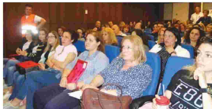
Κατά τη διάρκεια της χθεσινής πρώτης μέρας πραγματοποιήθηκε σεμινάριο ΚΑΡΠΑ από τα μέλη της Ελληνικής Ομάδας Διάσωσης