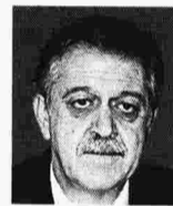
ΤΟΥ ΠΑΡΙ ΚΟΥΚΟΥΛΟΥΠΟΛΟΣ-ΠΟΥΛΟΥ

■ Ακύρωσαν μια επιλογή που στόχευε στην ανταγωνιστική kWh και επέλεξαν να μοιράζονται προκλητικά δώρα στα συμφέροντα, με μεγάλο χαμένο την οικιακή κατανάλωση και τις ελληνικές επιχειρήσεις.