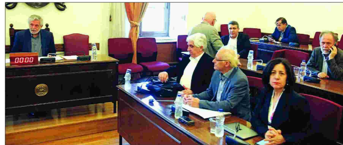
Από τη χθεσινή τελευταία συνεδρίαση της προκαταρκτικής επιτροπής για την υπόθεση Novartis

Από την άλλη πλευρά, τα κόμματα της αντιπολίτευσης έχουν καταθέσει τις δικές τους πορισματικές εκθέσεις, καταγγέλλοντας την κυβέρνηση για σκευωρία προκειμένου να πλήξει τους πολι-