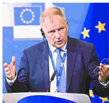
Ο επίτροπος Υγείας Βιτένις Αντριουκάιτις διαθέτει στη χώρα μας τα κονδύλια για την επέκταση των εμβολιασμών

Πάντως, όπως επισήμανε ο επίτροπος Υγείας, η σχέση των ευρωπαϊκών οργάνων με το ελληνικό υπουργείο Υγείας είναι ιδιαίτερος στενή για την αντιμετώπιση του κύματος της ιλαράς, ενώ σε εφαρμογή έχει τεθεί και το σχέδιο «φόβος» για την εξάλειψη της νόσου.