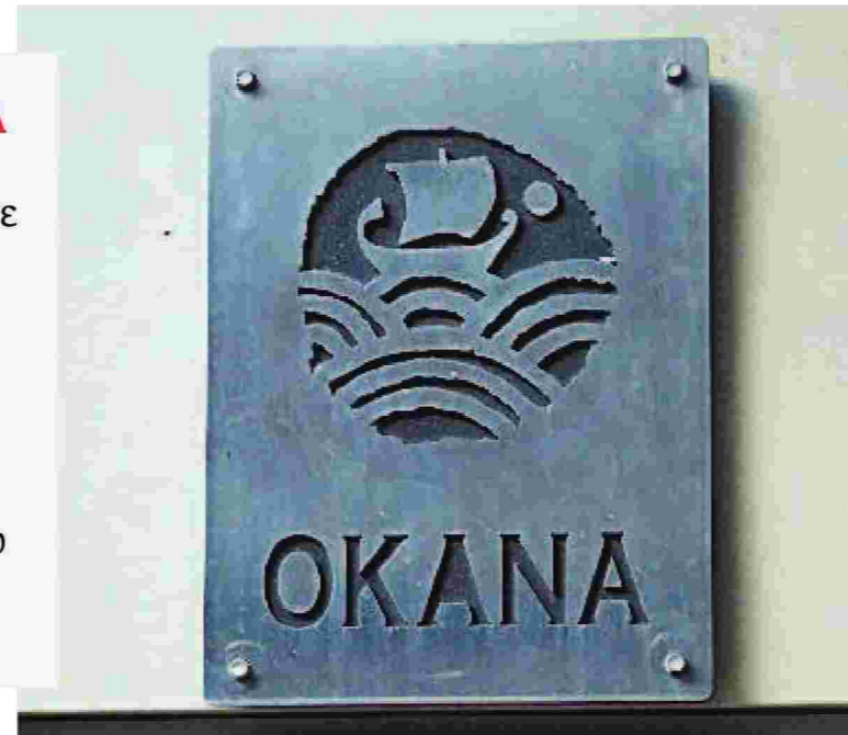
ΕΥΡΟΚΙΝΗΣΗ / ΣΤΕΛΙΟΣ ΜΙΖΙΝΑΣ

Καλή, χρήσιμη και απαραίτητη η νέα μονάδα, αλλά εξυπηρετεί μόλις 30 άτομα και έχει δυναμικότητα περί τα 60. Στη μονάδα υποκατάστατων εξυπηρετούνταν σχεδόν 200 άτομα. Δεν πάει χρόνος που άλλη μια μονάδα άλλαξε χαρακτήρα, πάλι σε δημόσιο νοσοκομείο. Η μονάδα στον Άγιο Δημήτριο, που εξυπηρετούσε άλλα 150 άτομα, μετατράπηκε με τη σειρά της σε μονάδα συνταγογράφησης. Πού μεταφέρθηκαν όλοι όσοι ήταν στο πρόγραμμα; «Στις άλλες επτά μονάδες της πόλης, οι οποίες έχουν “μπουκώσει”, όπως “μπούκωμα” υπάρχει και στη λίστα αναμονής, που μεγάλωσε από 5 σε οκτώ μήνες», λέει στην «Εφ.Συν.» ο πρόεδρος του συλλόγου εργαζομένων στον ΟΚΑΝΑ, Άγγελος Αγγελίδης. Για τον κ. Αγγελίδη, «κακώς ο ΟΚΑΝΑ δέχθηκε αυτή τη μετατροπή. Φυσικά και έπρεπε να υπάρχει Μονάδα Επανάταξης και Στήριξης, αλλά όχι να κλείσει η πετυχημένη μονάδα υποκατάστατων. Εφτά χρόνια δούλεψα σε αυτή τη μονάδα και γνωρίζω τον πόλεμο που δέχθηκε από το πανεπιστήμιο και τοπικά μίντια, που υπέβαλλαν φοβικά αντανάκλαστικά. Χάσαμε μια μάχη, ο αγώνας συνεχίζεται».