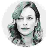
ΓΡΑΦΕΙΗ ΔΗΜΗΤΡΑ ΕΥΘΥΜΙΑΔΟΥ