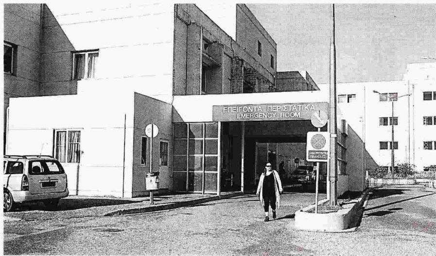
Δεν μπορούμε να αρνηθούμε βοήθεια, λέει ο διοικητής. Και 23 να δεχθείς, θα σου έρθουν 43