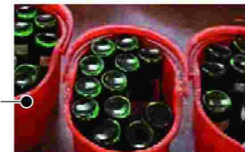
Διαδικασία αφαίρεσης ταινίας ασφαλείας και ετικέτας με μπουκάλια ποτών που έχουν έρθει παράνομα από τη Βουλγαρία.