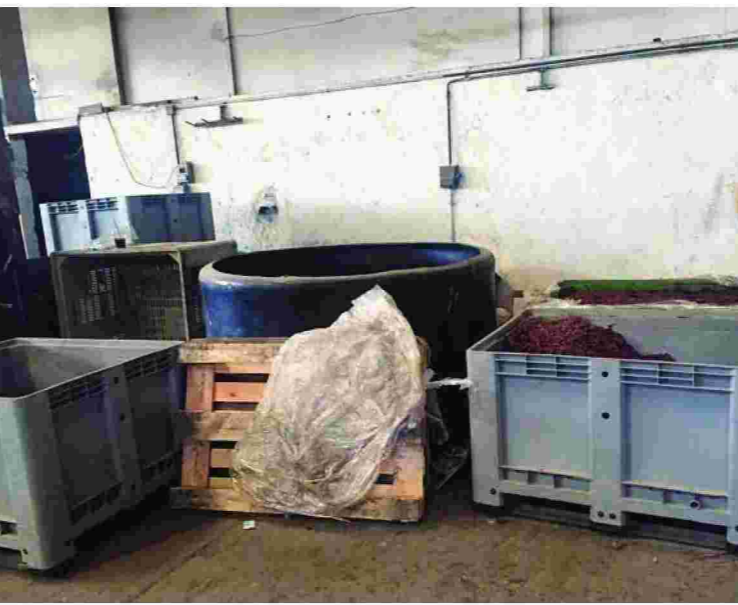
Συνθήκες υγιεινής στα εργαστήρια παρασκευής νοθευμένων ποτών απλώς δεν υφίστανται. Οι ερευνητές εντοπίζουν ποτικία και καταριές δίπλα στα ποτά.

«Η διαφορά είναι τεράστια, περίπου 6-7 ευρώ τη φιάλη», λέει ο κ.