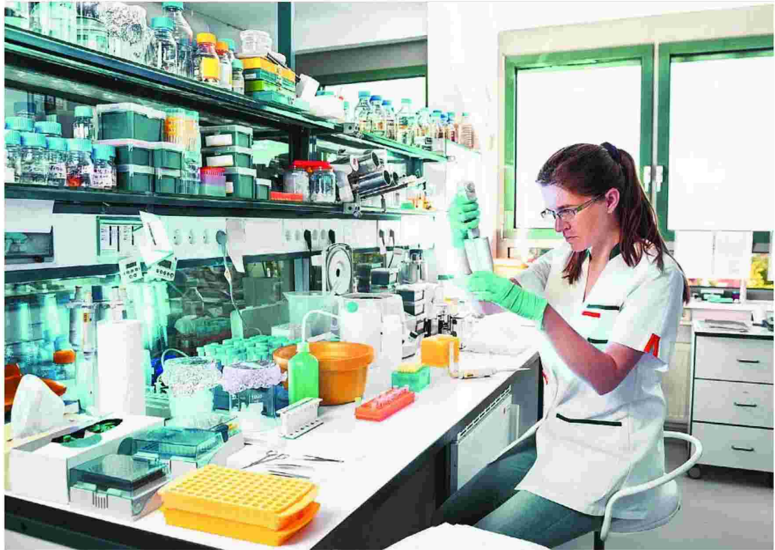
Σύμφωνα με τα τελευταία διαθέσιμα στοιχεία, το 2015 πραγματοποιήθηκαν στη χώρα μας 13.000 κύκλοι εξωσωματικής γονιμοποίησης.

Όπως τόνισαν τα μέλη της Αρχής, σήμερα κάποιος μπορεί να δωρίζει σπέρμα σε πολλές Μονάδες ταυτό-