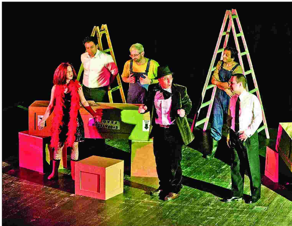
Η θεατρική ομάδα Ληνός ανεβάζει παραστάσεις σε όλη τη Θεσσαλονίκη