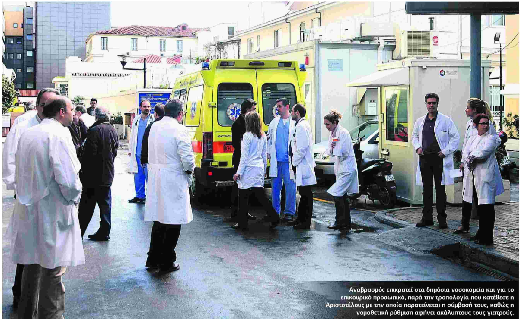
Αναβρασμός επικρατεί στα δημόσια νοσοκομεία και για το επικουρικό προσωπικό, παρά την τροπολογία που κατέθεσε η Αριστοτέλους με την οποία παρατείνεται η σύμβασή τους, καθώς η νομοθετική ρύθμιση αφήνει ακάλυπτους τους γιατρούς.

ΝΟΣΟΚΟΜΕΙΑ: ΑΛΛΑΟΥΜ ΜΕ ΤΙΣ ΣΥΜΒΑΣΕΙΣ, ΓΙΑ ΜΗΝΕΣ ΧΩΡΙΣ ΜΙΣΘΟ ΚΑΘΑΡΙΣΤΕΣ, ΦΥΛΑΚΕΣ, ΤΡΑΠΕΖΟΚΟΜΟΙ