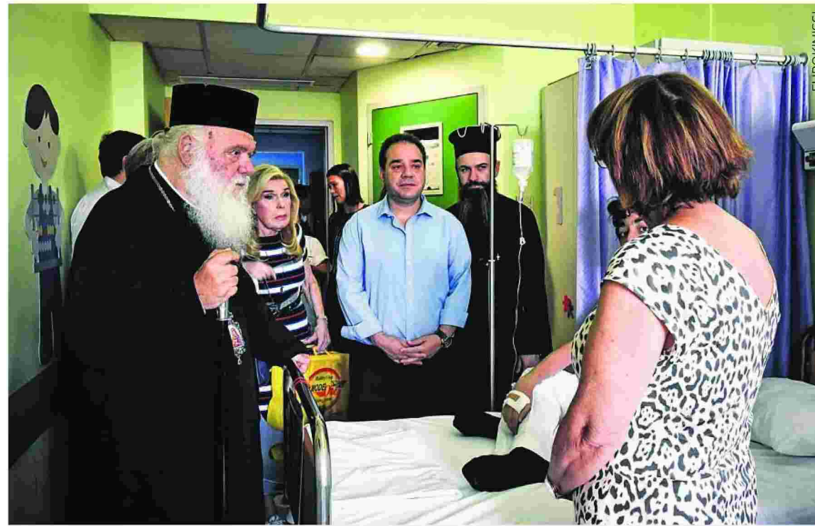
Τους τραυματίες στον Ευαγγελισμό και στο Παίδων «Αγία Σοφία» επισκέφθηκε χθες ο Αρχιεπίσκοπος Ιερώνυμος με την πρόεδρο του «Ελπίδα» Μαριάννα Βαρδινογιάννη.

Νοσηλεύονται 60 ενήλικες, εκ των οποίων οι 11 στην εντατική και 4 παιδιά χωρίς σοβαρά προβλήματα