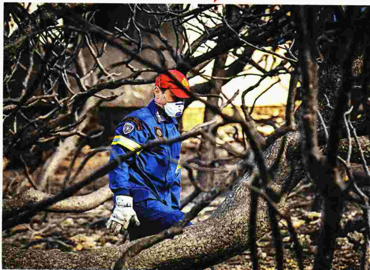
ΕΥΡΩΚΙΝΗΣΗ / ΤΑΤΙΑΝΑ ΜΠΟΛΩΡΗ

Οι έρευνες της Πυροσβεστικής και της ΕΜΑΚ για αγνοουμένους συνεχίζονται στο Μάτι και στη Ραφήνα