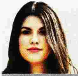
THE EYHE ΣΑΛΤΟΥ

Η κυβέρνηση αποφεύγει να ανακοινώσει επίσημα τον αριθμό όσων αναζητούνται ακόμη