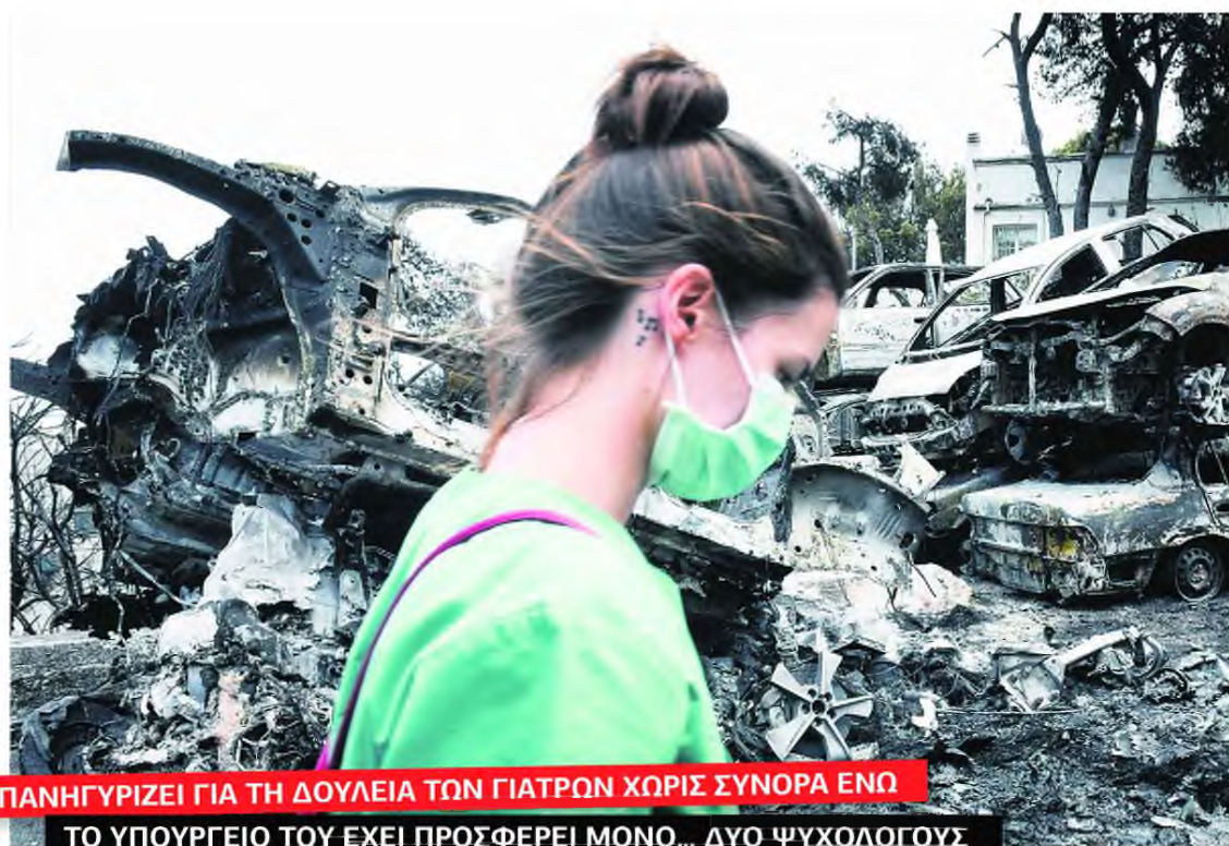
ΠΑΝΗΓΥΡΙΖΕΙ ΓΙΑ ΤΗ ΔΟΥΛΕΙΑ ΤΩΝ ΓΙΑΤΡΩΝ ΧΩΡΙΣ ΣΥΝΟΡΑ ΕΝΩ ΤΟ ΥΠΟΥΡΓΕΙΟ ΤΟΥ ΕΧΕΙ ΠΡΟΣΦΕΡΕΙ ΜΟΝΟ... ΔΥΟ ΨΥΧΟΛΟΓΟΥΣ