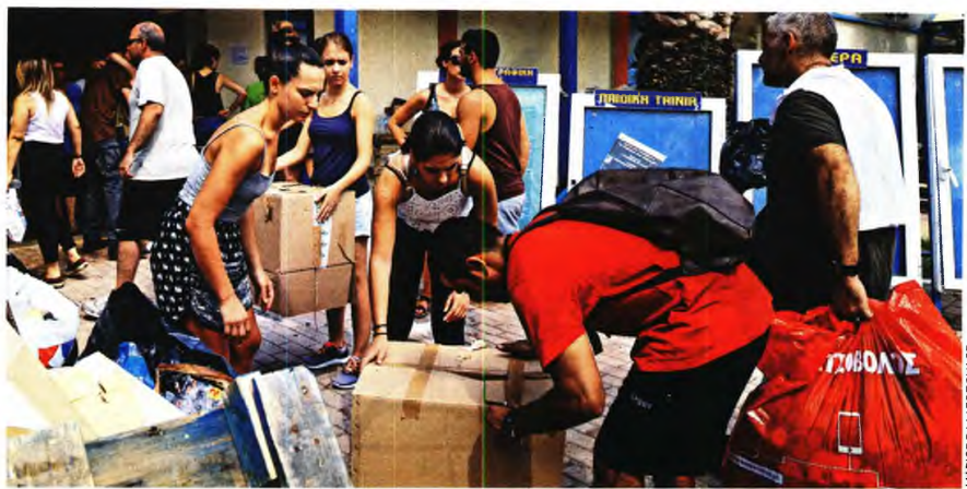
Όλες αυτές τις μέρες, εθελοντές από οργανώσεις, αλλά και με ατομική πρωτοβουλία, βρίσκονται στις περιοχές που αντιμετώπισαν τα μεγαλύτερα προβλήματα από τις πυρκαγιές και προσφέρουν τις υπηρεσίες τους με όποιον τρόπο μπορούν

Το παράδειγμα των ιδιωτικών επιχειρήσεων που προηγήθηκαν τις προηγούμενες μέρες προσφέροντας οικονομική ενίσχυση στους πυροπαθείς, ακολούθησε το Δ.Σ. του ομίλου επιχειρήσεων Μτιλιναίους που αποφάσισε να καταθέσει στον Ειδικό Λογαριασμό Αρωγής της Πραξένης της Ελλάδος το ποσό του ενός εκατομμυ-