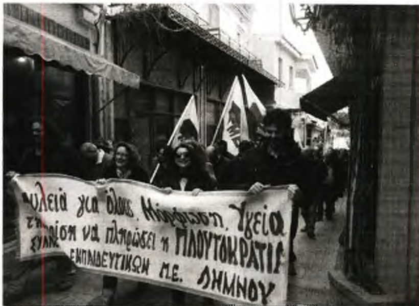
Στιγμιότυπο από την απεργία στις 12 Γενάρη στη Λήμνο

ναισθησιολόγο, παθολόγο και όλο το ιατρικό και λοιπό προσωπικό που προβλέπει ο ισχύων κανονισμός λειτουργίας του.