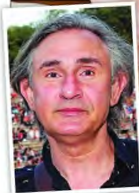
Ψυχτικός συντηρεί κλιματιστικό. Ενθετή: Ο ηθοποιός Ακης Σακελλαρίου

κατάλληλων μέτρων για τη σωστή λειτουργία των υδραυλικών και κλιματιστικών εγκαταστάσεων με υδρόψυκτους πύργους ψύξης, ιδιαίτερα σε χώρους όπως ξενοδοχειακές εγκαταστάσεις, αθλητικές εγκαταστάσεις, υδάτινα πάρκα, νοσοκομεία , ιαματικά λουτρά, κρουαζιερόπλοια, αλλά και η αποφυγή δημιουργίας εστίας μόλυνσης στα σημεία των δικτύων όπου