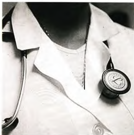
Χωρίς παραπεμπτικό οι επισκέψεις σε γιατρό έως τα τέλη 2018

Α πό την 1η Ιανουαρίου 2019 θα ξεκινήσει η εφαρμογή του συστήματος παραπομπών από τον οικογενειακό γιατρό σε εξειδικευμένη φροντίδα, δηλαδή σε ειδικό γιατρό ή νοσοκομείο. Στη διευκρίνιση αυτή προχώρησε, χθες, το υπουργείο Υγείας με αφορμή τη σύγκυση της επίσημης εφαρμογής του θεσμού του οικογενειακού γιατρού που ξεκίνησε χθες, με το σύστημα παραπομπών. Η σύγκυση αυτή οδήγησε μάλιστα τον Ιατρικό Σύλλογο Αθηνών να καλέσει τους γιατρούς, που είναι συμβεβλημένοι με τον ΕΟΠΥΥ , να διακόψουν άμεσα την παροχή δωρεάν υπηρεσιών στους ασφαλισμένους, τουλάχιστον έως ότου το υπουργείο Υγείας περιγράψει με σαφήνεια τις διαδικασίες για το νέο σύστημα. Σύμφωνα με το υπουργείο Υγείας, το σύστημα παραπομπών θα εφαρμοστεί από την 1η Ιανουαρίου 2019 σταδιακά και ανάλογα με το επίπεδο κάλυψης του πληθυσμού από οικογενειακούς γιατρούς. «Μέχρι τότε οι ασφαλισμένοι θα εξακολουθήσουν να επισκέπτονται δωρεάν και χωρίς παραπεμπτικό τους συμβεβλημένους γιατρούς όλων των ειδικοτήτων», τονίζει το υπουργείο Υγείας, επισημαίνοντας ότι τα έκτακτα και επείγοντα περιστατικά ούτως ή άλλως εξαιρούνται από τις διαδικασίες παραπομπής. Υπενθυμίζεται ότι με βάση