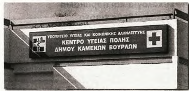
Μόνο η ταμπέλα απεμεινε να θυμίζει το Κέντρο Υγείας στα Καμένα Βούρλα

Ο θάνατος του 42χρονου άνδρα δεν αποτελεί μεμονωμένο ούτε σημερινό γεγονός κι όπως ήταν αναμενόμενο η κυβέρνηση, που συνεχίζει επάξια το έργο των προκατόχων της, τηρεί «σιγήν ιχθύος». Όσο για την προκλητική ανακοίνωση της ΝΔ που - με αφορμή το γεγονός - «κατηγορεί» την κυβέρνηση «για δημιουργία νέων αχρείαστων κρατικών δομών που επιβαρύνουν τον προϋπολογισμό», απλά προμηγνύει ότι η κατάσταση στο χώρο της Υγείας θα επιδεινωθεί. Η βολική αντιπαράθεση