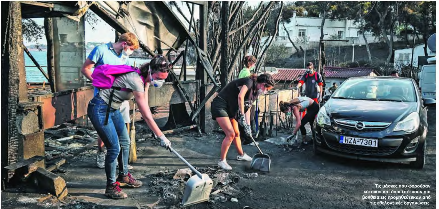
Τις μάσκες που φορούσαν κάτοικοι και όσοι έσπευσαν για βοήθεια τις προμηθεύτηκαν από τις εθελοντικές οργανώσεις.

Οι όποιες αναλύσεις για ρύπανση ή μόλυνση στην περιοχή αφορούσαν μόνο το νερό, ενώ η Πολιτεία δεν «σκέφτηκε» καν να μοιράσει μάσκες στους κατοίκους!