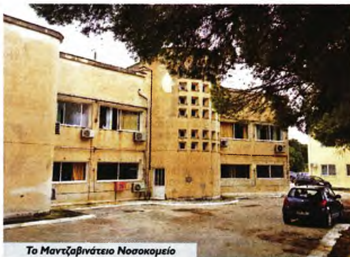
Το Μαντζαβινάτειο Νοσοκομείο

Σε ό,τι αφορά το Μαντζαβινάτειο, επισημαίνεται ότι καμιά λύση δεν υπάρχει για τη στελέχωσή του με παθολόγους γιατρούς μετά την αποχώρηση τριών που συνταξιοδοτήθηκαν. «Αφού έκλεισαν την