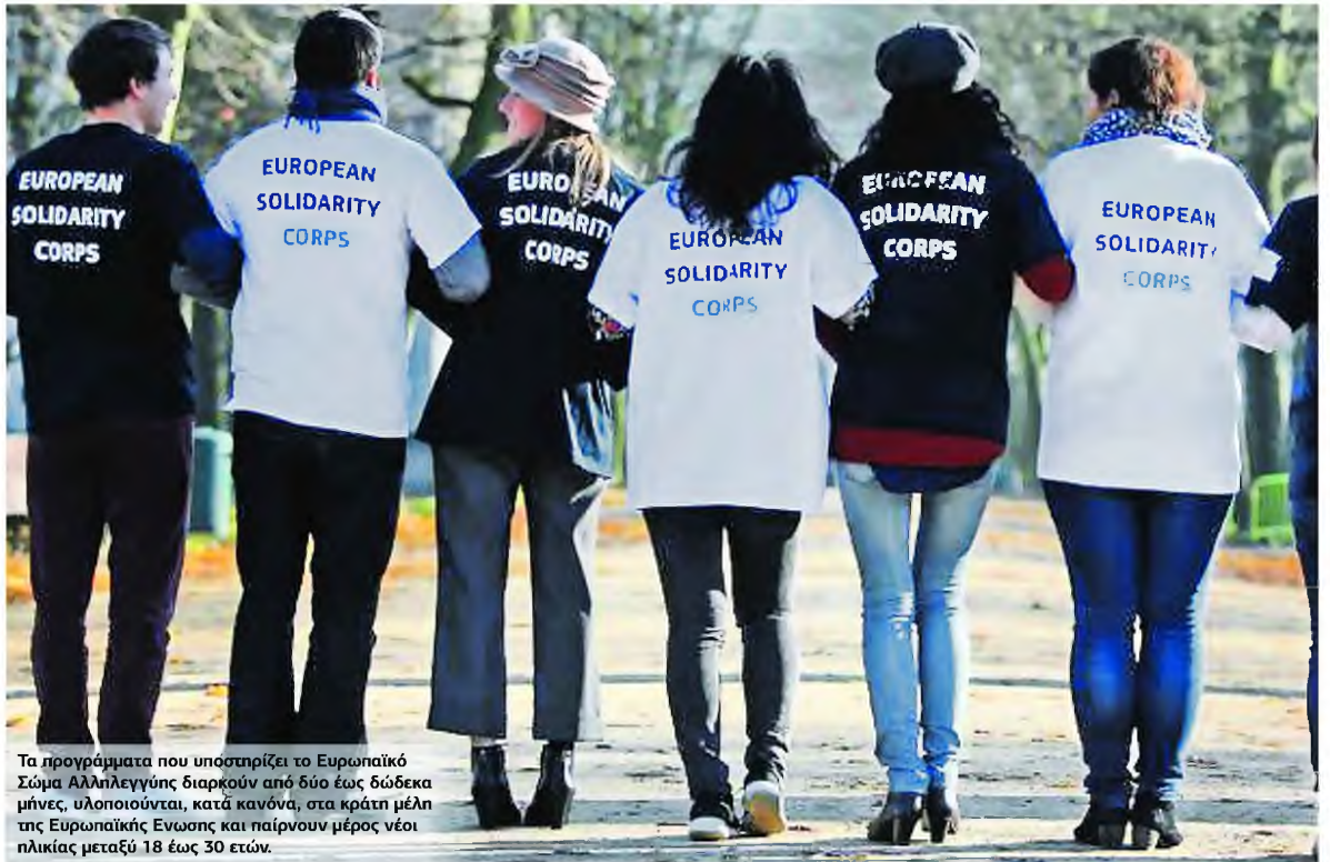
Τα προγράμματα που υποστηρίζει το Ευρωπαϊκό Σώμα Αλληλεγγύης διαρκούν από δύο έως δώδεκα μήνες, υλοποιούνται, κατά κανόνα, στα κράτη μέλη της Ευρωπαϊκής Ένωσης και παίρνουν μέρος νέοι ηλικίας μεταξύ 18 έως 30 ετών.

► Το Ευρωπαϊκό Σώμα Αλληλεγγύης θα διαθέσει το 90% των πόρων του